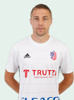
Roman Mihai I