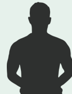
Omrani Abdel Billel

27 JOCURI 15 GOLURI 2 PENALTY-URI SCOASE