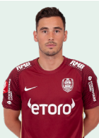
Hammershøy- Mistrati Vito