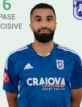
FC U CRAIOVA 1948