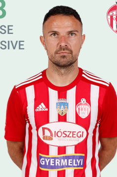
SEPSI OSK SF. GHEORGHE