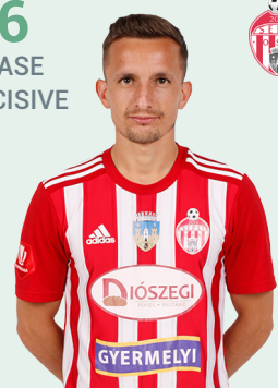
SEPSI OSK SF. GHEORGHE