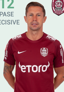
CFR 1907 CLUJ