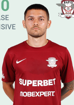
FC RAPID 1923