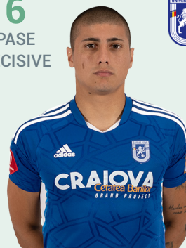
FC U CRAIOVA 1948