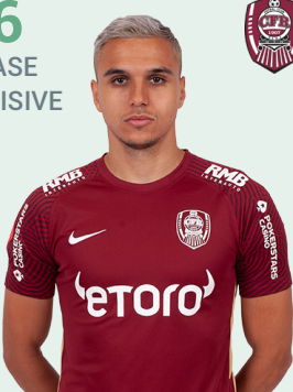
CFR 1907 CLUJ